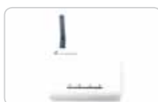
Centrałka inteligentnego sterowania budynkiem