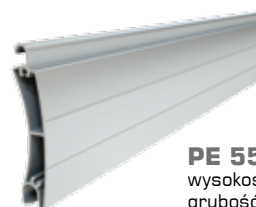
PE 55 wysokość profilu: 55 mm grubość: 14 mm