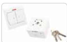
Przełączniki klawiszowe i kluczykowe